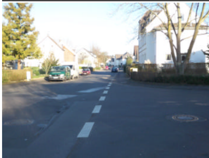
Parken im Strassenverlauf